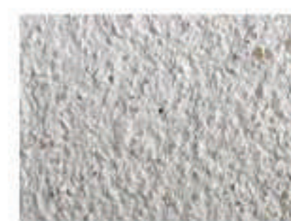
T beige clair 1005-Y20R