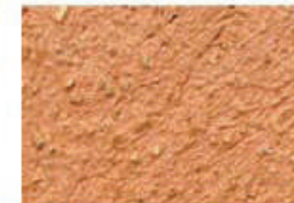
T rouge foncé 4030-Y50R

Ces teintes peuvent s'appliquer sur les façades d'immeubles à peindre. Les références proviennent du Natural Color System (N.C.S.).