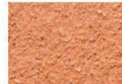
T rouge brique 2040-Y60R