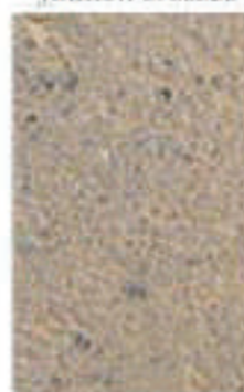
sable roux 1