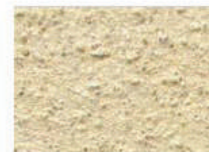
T jaune 1030-Y15R