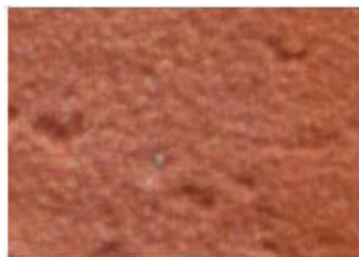
brique moulée rose