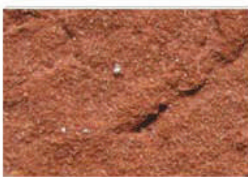
brique moulée rouge