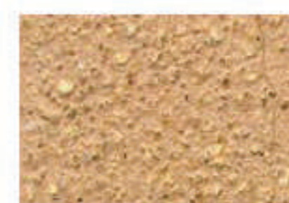
T ocre orangé 3030-Y30R