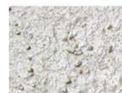
T grège 3010-Y20R