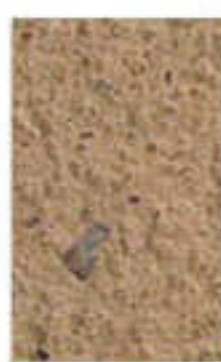
sables rose et jaune