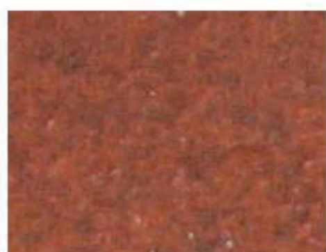
tuile rouge vieillie