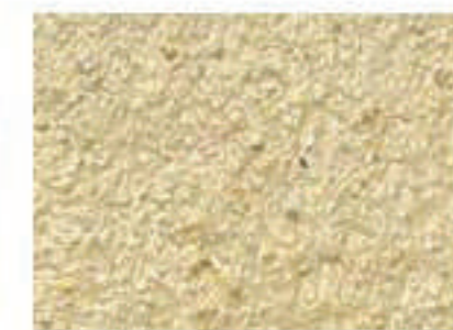
T paille 2030-Y10R