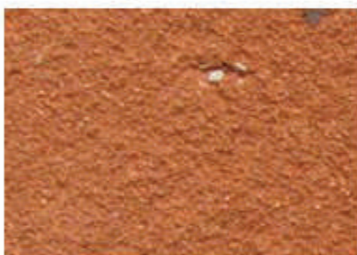
brique moulée orangée