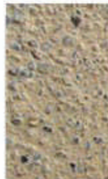
sables gris et jaune