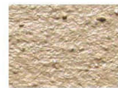
T terre 2020-Y25R