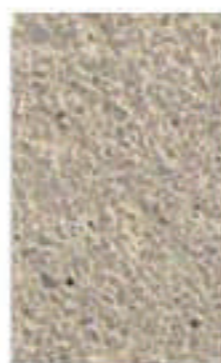
sable roux 2