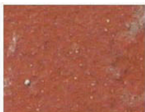
tuile ocre rouge