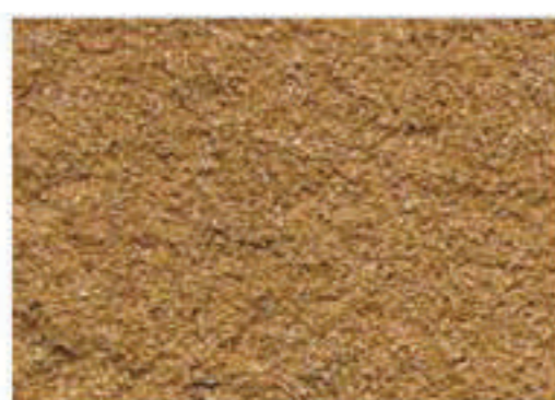
brique moulée paille