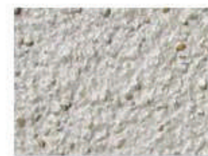
T beige 2010-Y20R