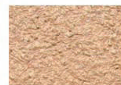
T ocre rose 2520-Y40R